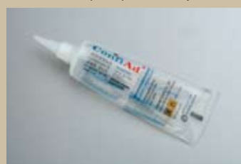
H-02(70 г) Инсталляционный