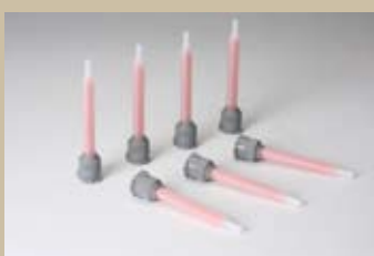
M-250M / M-485M (250ml/485ml*)